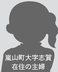
嵐山町大字志賀 在住の主婦

「ごみの減量」に何か協力できないか考えて、平成21年5月から「電気式の生ごみ処理機」を町の補助金をいただき購入しました。「電気式の生ごみ処理機」を使用して次のようなメリットがあります。