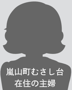
嵐山町むさし台 在住の主婦

平成15年に「電気式の生ごみ処理機」を町の補助金を いただいて購入し、キッチンに置いて使用しています。 「燃えるごみ」に出すごみの量が減り、「燃えるごみ」を集 積所へ出す回数が減りました。また、「燃えるごみ」の袋 の中に生ごみを入れないのでごみ出しが軽くて大変楽に なりました。