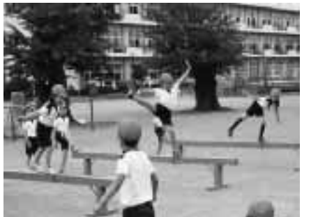
「バランスとって はい ポーズ」

学習を通して、子どもたちは上達する喜びとみんなうまくいったという一体感を持つことができた。また、中・高学年では個からチーム、チームからクラスへのよりよい集団意識が育っています。日常の活動としては、業間休み(15分)、昼休み(20分)に運動遊びを進めています。さらに週1回、業前運動(15分)や、ロング昼休み(45分)、また1〜6年異学年合同の縦割り班による外遊びを設定しています。これらの活動で遊びながらも体力向上を図っています。