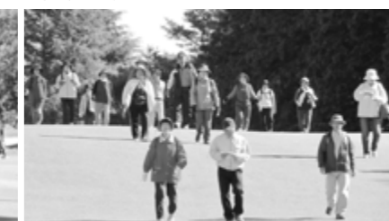
整備されたフェアウェイが気持ちいい