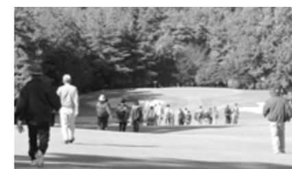
美しい景色を眺ながらウォーキング