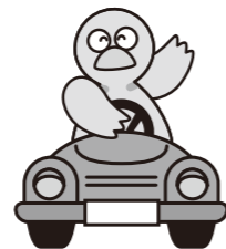
「埼玉県のマスコット コバトン」

ボーッとしての運転、 ついうっかりで、信号 や標識の見落としの事 故が増えています。運 転には十分気をつけま しょう。