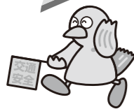
「埼玉県のマスコット コバトン」