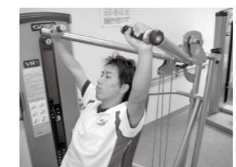
オーバーヘッドプレス

★ マルチプレスの効果は・・・ ①上半身の筋力アップ「肩、胸、腕を鍛え、逞しい上半身を作る」 ②基礎代謝の向上「何もしていない時でも脂肪が燃える」 ③体力の向上「普段の生活で疲れにくくなる」 ④体型の変化「筋量が増えて引き締まった身体に」