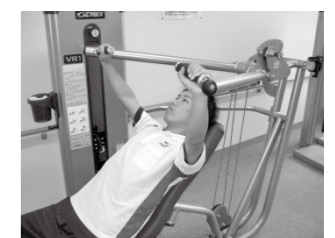
インクラインベンチプレス

★ 「トレーニングルーム」の利用は無料！！ ☆様々な目的を可能にするマルチプレス 町民の健康づくりに積極的に利用して頂くため、20歳以上の方(治療中の病気や疾病をお持ちの方を除く)は、やすらぎの入館料(町民の方 1回200円)のみでご利用頂けます。