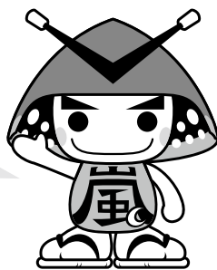
嵐山町マスコットキャラクター「むさし嵐丸」

※納期限を過ぎた納付書はコンビニで使えませんので、金融機関または税務課窓口、ふれあい交流センターでお願いいたします。