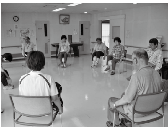
※シニアいきいきなごみ講座の様子