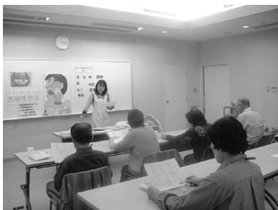
※元気はつらつ口腔教室の様子

姿勢や歩き方など、基本的なところから、少しずつ身体を動かしていく教室です。運動不足になりがちな方、これから運動を始めようと考えている方、楽しみながら、一緒に体を動かしましょう。