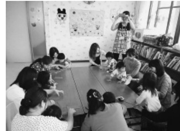
ステーションアイプラザがこども拠点へ