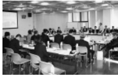
11/13 徳島県町村議会議長会

主な研修内容 ● 議会活性化の取り組み ● 議会基本条例 ● 議会報告会 ● 専門的知見の活用 ● 議会モニター