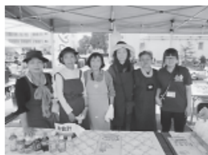
模擬店や運営のお手伝いで大活躍しました