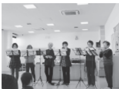
コスモスオカリナの方々が演奏する童謡に合わせ、みんなで一緒に手遊びをしました