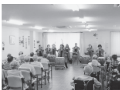
華麗なバチさばきを披露し、イベントを盛り上げました