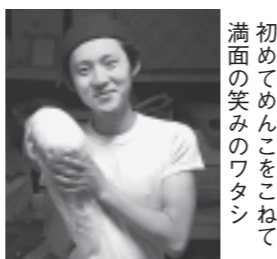
初めてのめんこをこねて満面の笑みのワタシ