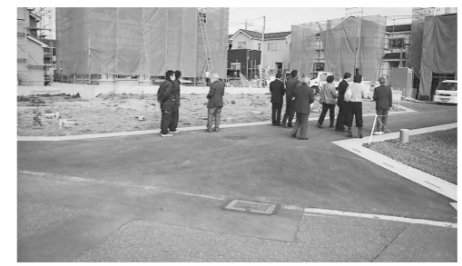
町道に認定すべきかの現地調査の様子

12月4日、嵐山町菅谷9区内に民間業者が開発している住宅地を通る道路を町道に認定すべきか、総務経済常任委員会が審査を行った。