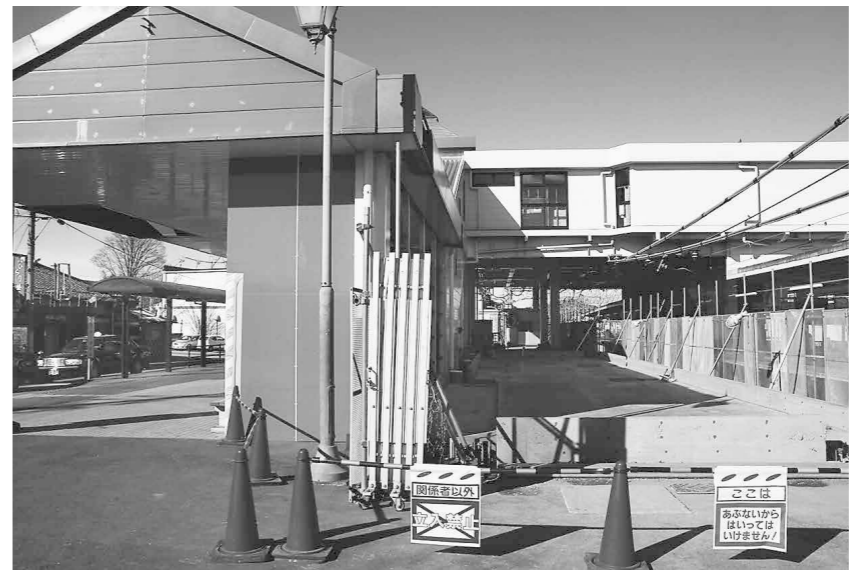
地域活力創出拠点施設整備（武蔵嵐山駅）＝12月27日

◆案内表示板、シャッターデザインなど Q 監視カメラは何台か A 1、2階とも2台ずつ