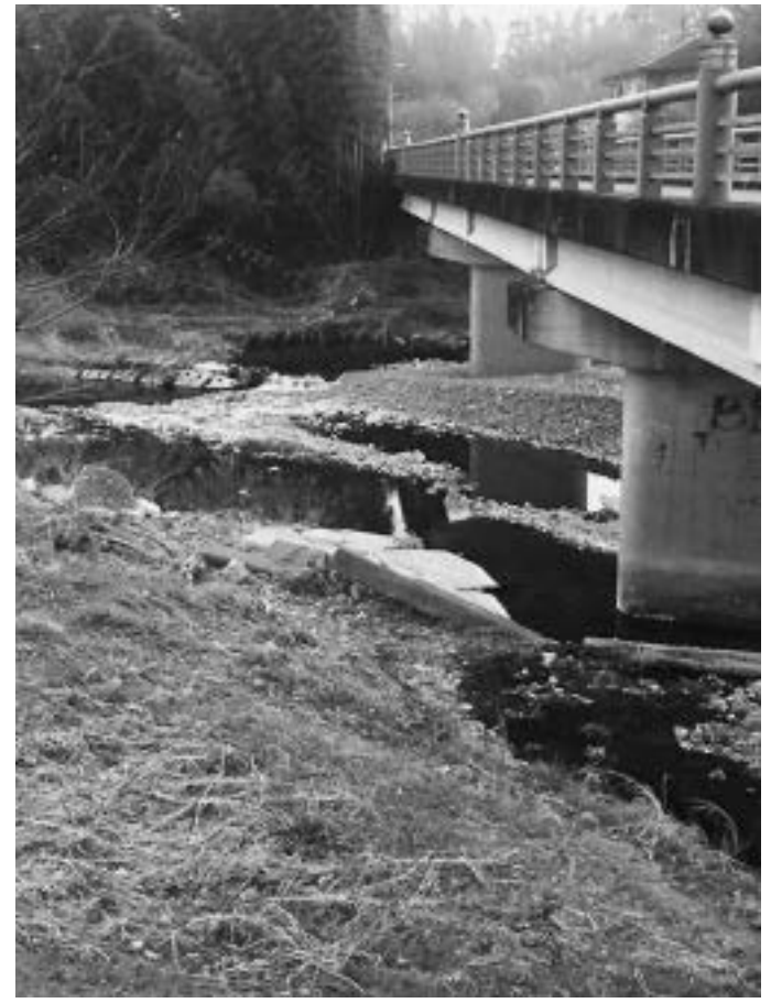
急がれる班溪寺橋周辺の改修