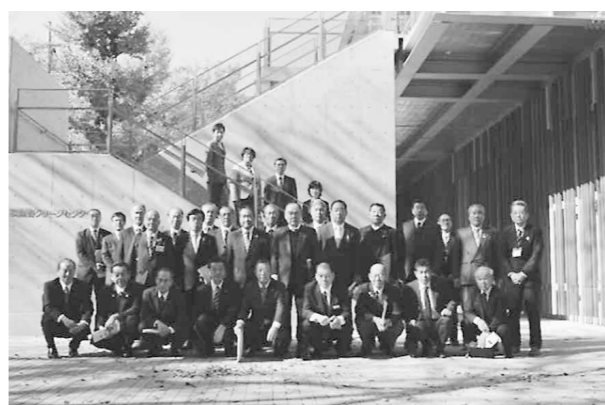
武蔵野クリーンセンターにて

クリーンプラザ(ふじみ)は、平成22年着工・平成25年4月竣工でDBO方式により民間事業者