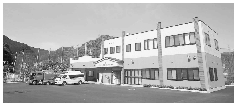
東秩父村御堂地内に移設された比企広域東秩父分署

議案第19号 平成30年度消防特別会計補正予算（第1号）について ・消防団員の退団者が多くなり退職報償基金受入金から423万円補正