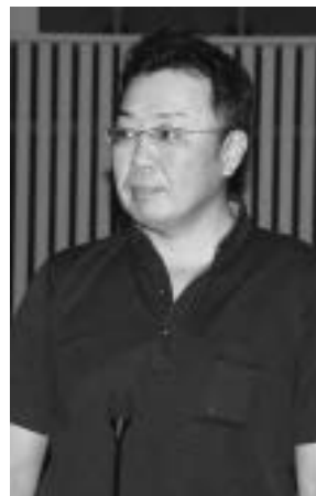
森 一人 議員