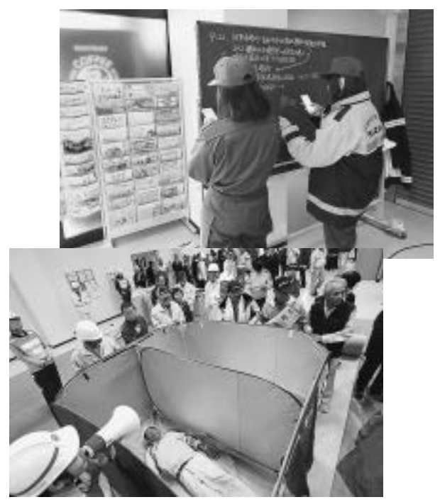
町で初の避難所開設訓練＝H29. 10. 15

答 地域支援課長 火災発生時の連絡は現状の方法で行う事とし、受令機を配備する考えはない。