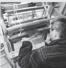
はた織りをする利用者

施設では、入所利用者の皆さんの「健康で元気に暮らしたい」「はた織りや絵画、陶芸作品などを通して表現したい」「能力を活かして働きたい」などの気持ちに寄り添いながら、一人ひとりの豊かな生活を実現するために支援しています。