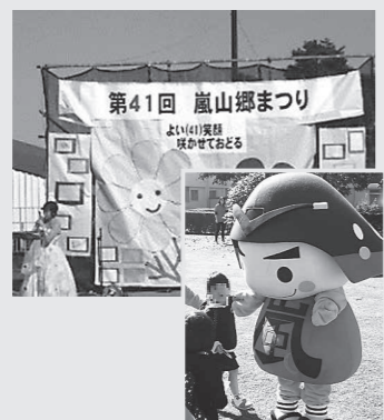
第41回 嵐山郷まつり

町民の皆さまには、障害者地域ふれあい事業、中学生の職業体験、嵐山まつり、花いっぱい