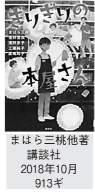
りりりの本屋さん まはら三桃他著 講談社 2018年10月 913ギ

商店街を抜けた路地にある小さくて古ぼけた本屋さんには、心がざりざりになっていくお客さんが立ち寄ります。店員さんのおすすめは何でしょう。