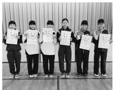
平成30年度マスターズグラウンド・ゴルフ大会4回戦 日程 2月18日