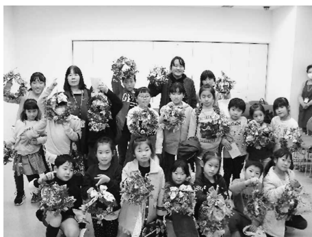
華やかなリースができました きっと、おうちの人も大喜び！

実施にあたり、ご協力いただいたボランティアどんぐりの会のみなさん、ありがとうございました。