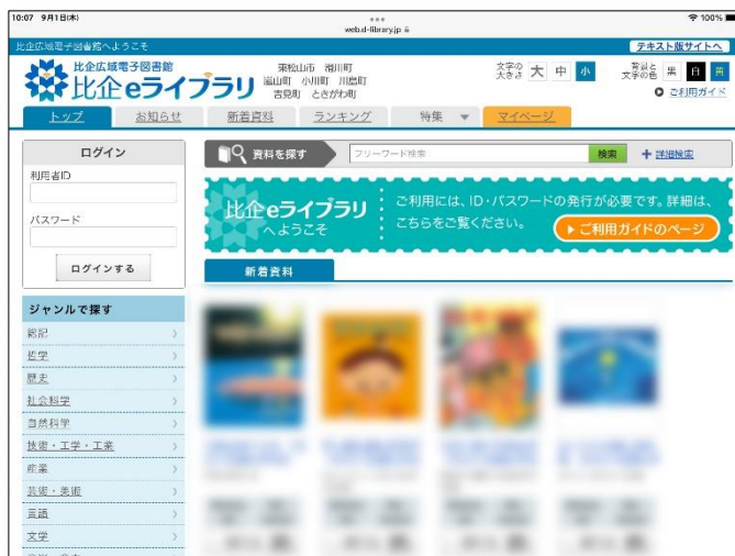
比企広域電子図書館「比企eライブラリ」ホームページ