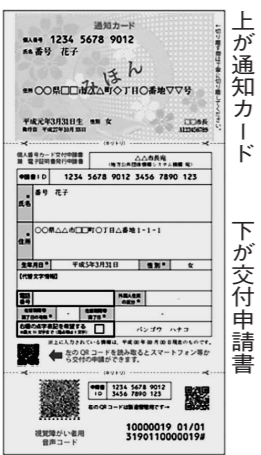
上が通知カード 下が交付申請書

前日までに町民課へ予約してください。写真撮影も無料で行います。予約された方以外の受付はできません(役場町民課での受付は随時行っています)。