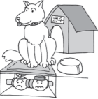
犬は出入口や水道メーターから離れた場所につないでおいてください。