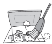
メーターボックスの中は、いつもきれいにしておいてください。