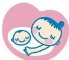
マタニティマーク

もうすぐお父さん、お母さんになる人を対象とした教室で沐浴練習を行います。 また出産後の手続きやサポート状況について個別にお話しをうかがいます。 年4回（5月、8月、11月、2月頃）対象となる方へご案内します。