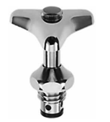
凍結防止水栓部品

⑤私有地の庭木や樹木等のお手入れ 私有地の庭木や樹木が雪の重みで倒れ、道路を塞ぎ、車両の通行の妨げになることがあります。日頃からの手入れをお願いします。