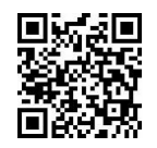
【事前申込】キャンドル作り