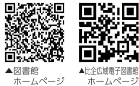
▲図書館ホームページ ▲比企広域電子図書館ホームページ