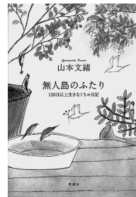
山本文緒著/2022年10月/新潮社/915.6p

人間ドックを毎年、受けていたにもかかわらず、いきなり「すい臓がんステージⅣ」の宣告を受けた著者。コロナ禍の自宅で、夫とふたりきりで過ごす闘病生活が始まりました。最期まで書くことを手放さなかった作家が綴っていた日記です。