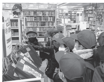
練習前に立ち寄ったライナース スポーツ少年団の子ども達

12月24日、職員おすすめの本、3冊を入れた福袋の貸出を開始しました。子ども達は、どんな本が入っているか、目をキラキラさせながら、袋の中を覗いていました。