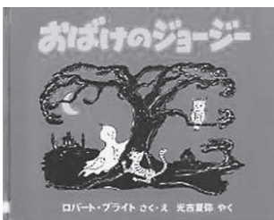
アメリカの絵本『おばけのジョージ』 ロバート・ブライト さく・え/光吉夏弥 訳/1978年6月/福音館書店/Eブ

世界中の昔話や民話、日常のできごと、学校の生活、戦争や平和など…。今月は、絵本で世界各国を感じられる作品をご紹介します。