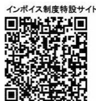
インボイス制度特設サイト

東松山税務署からのお知らせ 事業者の方向けにインボイス制度に関する説明会を次のとおり開催します。 令和5年10月から開始する消費税のインボイス制度の概要や消費税の基本的な仕組みについて説明を行いますので、ぜひご参加ください。