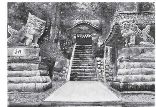
◀五十嵐さんの描いた鎌形八幡神社