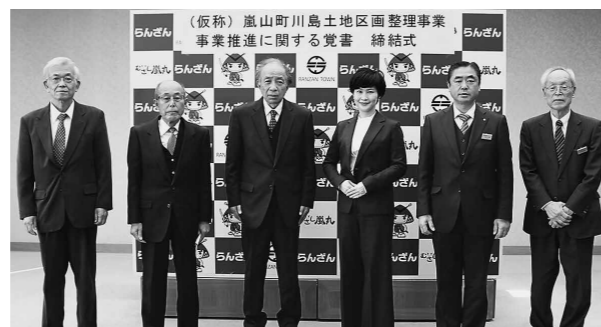
覚書締結式の様子