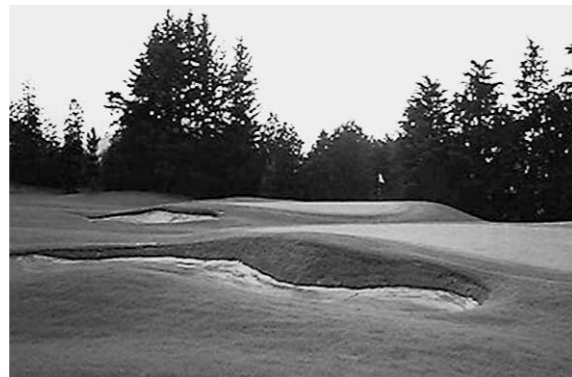
整備された綺麗な芝生