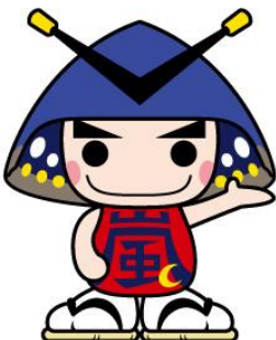
嵐山町マスコットキャラクター