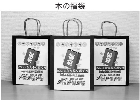
中身はあけてのお楽しみ!!

平成29年度に特定健診や人間ドックをご利用いただいた方(健康保険の種類に関わらずご利用いただけます)を対象に食事や運動など生活習慣改善に関する相談を行います。 日時 1月26日(金)、13時～15時の間30分ごとに受付、各定員3名。