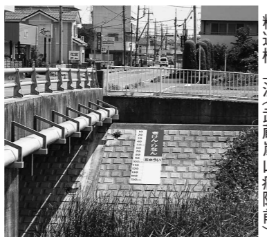
二瀬橋上流(嵐山町B&G海洋センター通り)