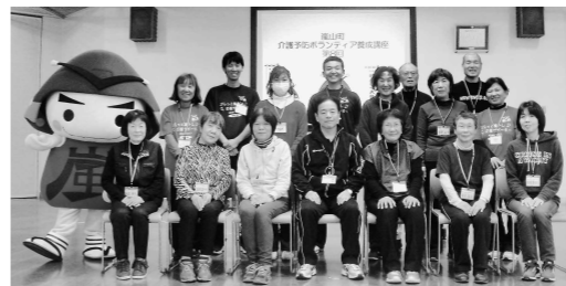
令和元年度サポーター養成講座修了式

日時 毎週水曜日 13時30分～15時30分 期間 10月7日(水)～11月25日(水) (全8回) 場所 町民ホール 講師 理学療法士 対象 次の2つの要件を満たす方 ①18歳以上の在住・在勤者 ②全8回のサポーター養成講座に5回以上参加できる方 定員 20名程度 費用 無料 服装 動きやすい服(ズボン)、運動靴 持ち物 タオル、飲み物、筆記用具、マスク