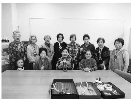
心を込めて作られた色鮮やかなメダル！