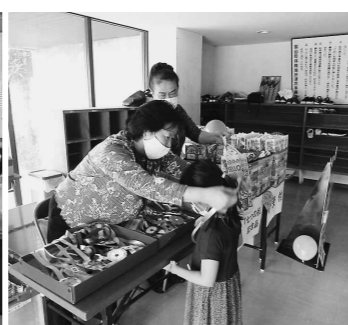
(会場) 菅谷小学校 菅谷婦人会