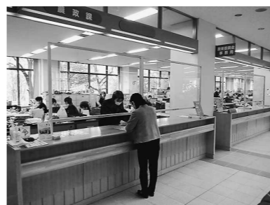
木製のカウンターと相性バッチリです

今回先行して農政課と農業委員会において、町内の木材で木枠を作った窓パネルを設置しました。高さ1m、長さ3mを超える大きなパネルです。木のぬくもりを感じるやさしい風合いになっています。役場にお越しの際にぜひご覧ください。