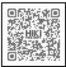
比企広域消防本部ホームページ

受付場所 比企広域消防本部管理課 ※申し込み願書は、消防本部、消防署、分署に準備してあります。 問合せ 比企広域消防本部管理課庶務係 ☎23-2265