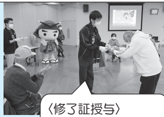
〈修了証授与〉 お疲れさまでした!