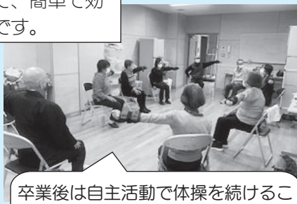
卒業後は自主活動で体操を続ける ことができます!(菅谷8区の様子)