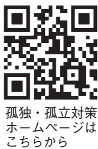
孤独・孤立対策はホームページからこちら

新型コロナウイルスの感染拡大の影響等により孤独・孤立で悩みを抱えている方が各種支援制度や相談先を探しやすくなるよう、自動応答により案内するシステムを搭載したホームページが新設されました。