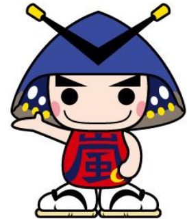
嵐山町のマスコットキャラクター