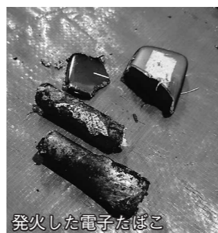
発火した電子たばこ

環境課 環境担当 ☎0493-62-0719 小川地区衛生組合 ☎0493-72-0441