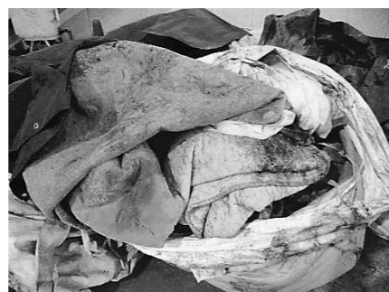
実際に「もえるごみ」として搬入された布団類

※粗大ごみは、小川地区衛生組合への自己搬入もしくは粗大ごみの有料戸別収集をご活用ください。