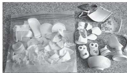
実際に無色ビンに混入していた不適物

無色・茶色びんは、ガラス類のリサイクルを行っていますが、正しい分別がされていないとリサイクルすることができなくなってしまいます。キャップ(フタ)を外して中を水洗いし、無色びん・茶色びんは、毎月第4水曜日に回収かごにいれて出してください。また、キャップは材質ごとに分別をして出してください。みなさまのご理解、ご協力をお願いします。