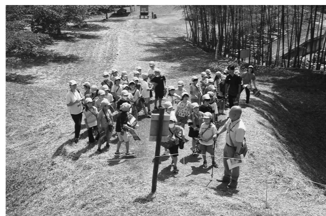
講座開催のようす

ご自分の持つ専門知識や技能を活かして、講師になってみたい方はぜひ新規登録をお願いします。なお講座の開催にあたっては、講師の方の交通費・講座に使用する原材料費等の必要経費を受講者が負担するものとします。