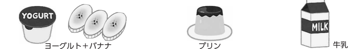
ヨーグルト+バナナ