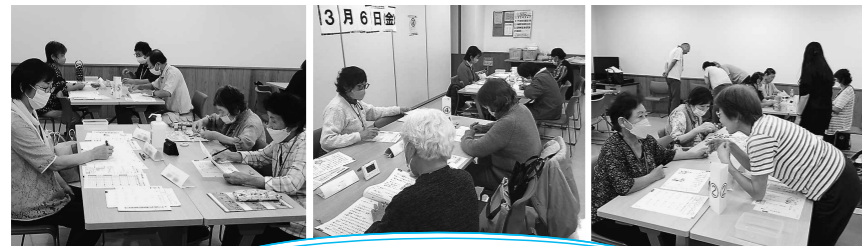
脳の健康教室の様子

脳の健康教室とは・・・地域のシニア世代のための「脳の健康づくり」を行う教室です。教室に参加して仲間と会話を楽しんだり、簡単な読み・書き、計算をすることで脳を活性化し、認知症予防につなげます。